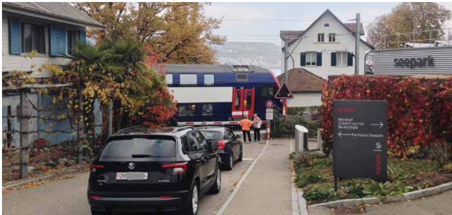
Abb. 1: Barriereanlage beim Seegüetli

Es kommt immer wieder vor, dass ungeduldige zu Fuss Gehende unter den Bahnschran- ken durchschlüpfen. Öffnen die Barrieren, so strömen die zu Fuss Gehenden über die Gleise und behindern den motorisierten Individualverkehr. Das Unfallrisiko ist entspre- chend gross. Ab und zu gelingt es nicht allen Fahrzeugen, die Bahngleise vor der erneu- ten Schliessung der Barriere zu passieren.