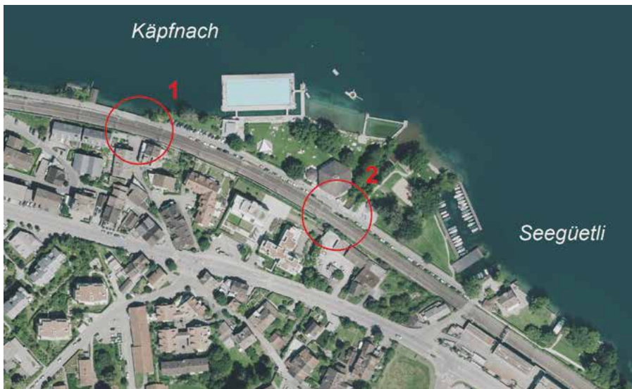
Abb. 2: Geprüfte Varianten für Unterführungen der SBB-Gleise

Variante 1: In der Verlängerung des Suterwegs führt eine ehemalige Flössereinrichtung zum Zürichsee und unterquert das Doppelspurgleis der SBB und die Strandbadstrasse. Mit einer Projektstudie wurde bereits im Juli 2011 geprüft, ob dieser Seezugang zu einer Personenunterführung ausgebaut werden könnte. Aufgrund der kostentreibenden Auflagen von SBB und Kanton (AWEL), rechtlichen Unsicherheiten sowie negativen Rückmeldungen der direkten Nachbarschaft wurde das bereits vorliegende Vorprojekt im Herbst 2013 sistiert.